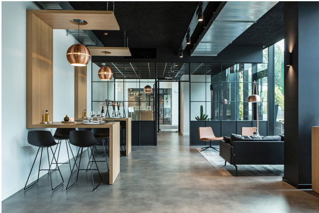
▲ Greenhouse Café voor ontbijt, lunch en catering bij vergaderingen.

De herinrichting is een realisatie van de eigen interieurarchitecten van Intervest. In de kantorenmarkt positioneert Intervest zich niet alleen als een verhuurder van louter vierkante meters, maar zorgt ook voor een brede waaier aan diensten en voorzieningen waaronder turn-key solutions. In het gebouw is geheel in de stijl van de renovatie door Intervest eveneens een restaurant voorzien, Greenhouse Café, uitgebaat door Cook & Style.