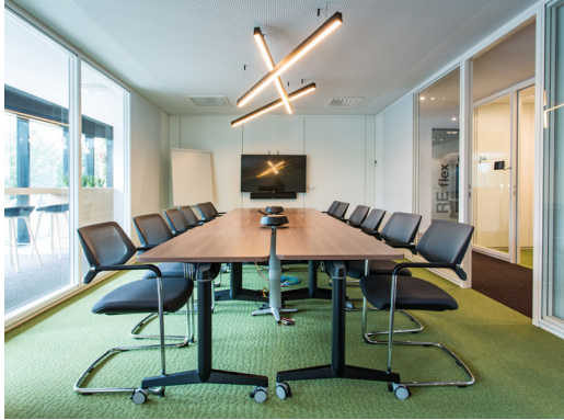
▲ RE:flex Berchem, trendy vergaderzaal

Intervest levert met groene gevel van 50.000 levende planten belangrijke bijdrage aan 'Groene Singel'