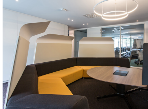
▲ RE:flex Berchem, inspirerende overlegruimte

“Ons geïntegreerd team van specialisten staat ten dienste van onze klanten voor een complete (her-)inrichting van hun kantoorruimte. Dat gaat dan van plannen, budgettering tot en met de opvolging van de werken binnen de vooropgestelde timing. Tijdens de renovatie en herinrichting van dit gebouw hebben alle klanten hun activiteiten kunnen blijven verder zetten en hebben meerdere onder hen gebruik gemaakt van deze turn-key solutions.”