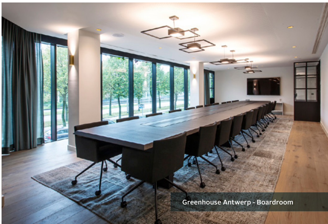
Greenhouse Antwerp - Boardroom

In geval het vereiste quorum niet zou bereikt zijn op de buitengewone algemene vergadering, zal een tweede buitengewone algemene vergadering worden gehouden op maandag 18 mei 2020 om 10.00 uur op de zetel van Intervest, om te beraadslagen over de agenda en voorstellen van besluit.