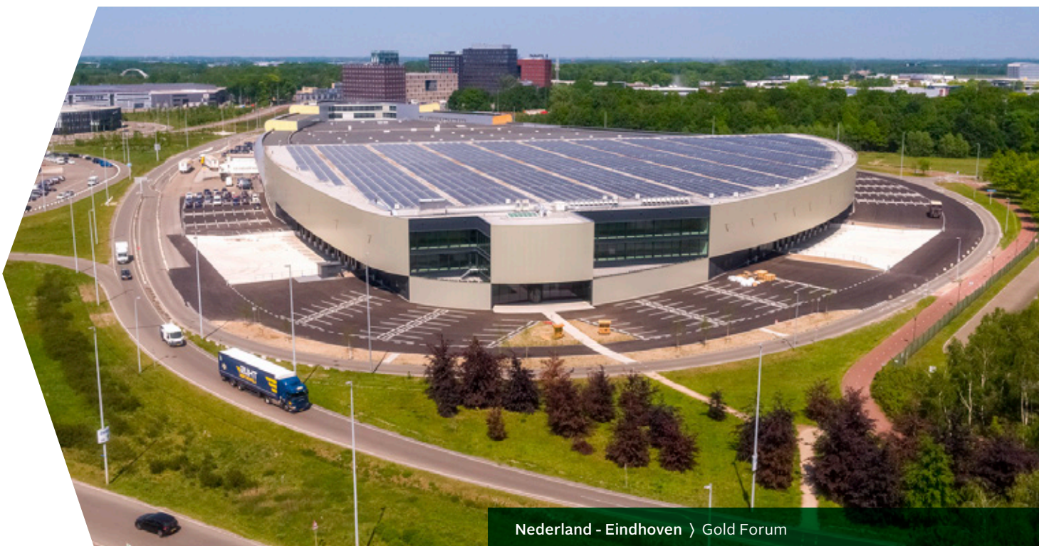
Nederland - Eindhoven › Gold Forum

Interinvest is bijzonder trots om dit duurzame en state-of-the-art distributiecentrum, dat in januari van dit jaar werd opgeleverd volgens BREEAM 'Very Good'-standaarden, te kunnen verhuren aan OneMed voor een periode van 10 jaar met twee breakmomenten. De operatie is mede mogelijk gemaakt door makelaar Q Bedrijfslocaties.