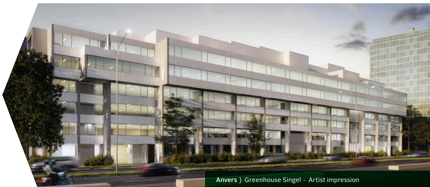
Anvers › Greenhouse Singel - Artist impression

Cette acquisition est en ligne avec la stratégie #connect2020 où il est question d'une rotation des actifs dans le segment des bureaux afin d'améliorer le profil de risques de l'ensemble du portefeuille. Ceci se traduit dans une réorientation vers des immeubles de bureaux plus orientés vers l'avenir dans des villes ayant une population estudiantine comme Anvers. Et du coup l'ambition de création de valeur durable avec l'équipe propre prend forme.