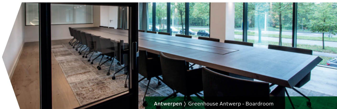
Antwerpen › Greenhouse Antwerp - Boardroom